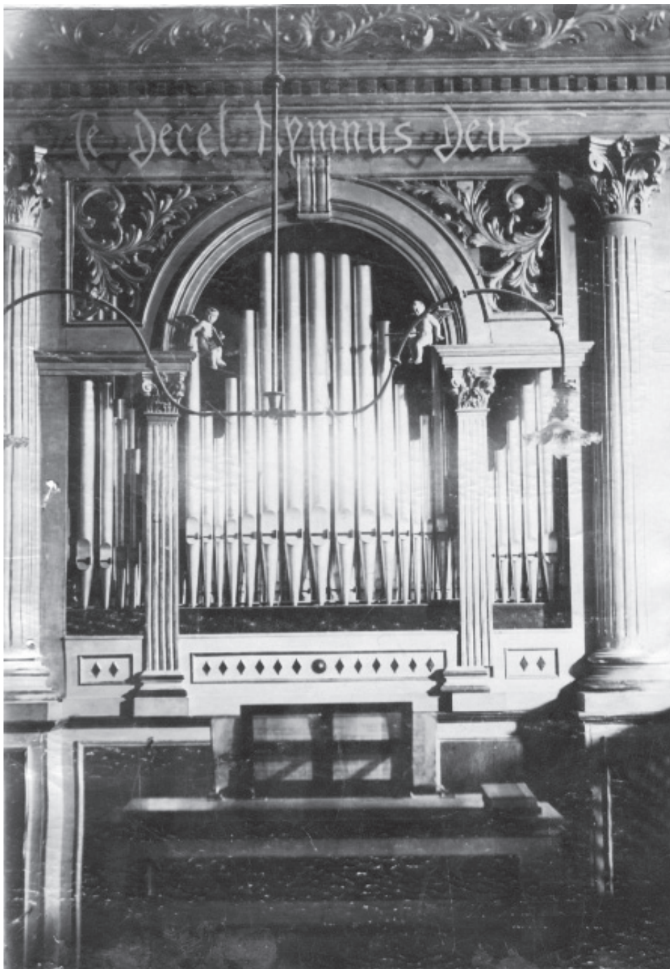
Orgulje u katedrali sv. Dujma