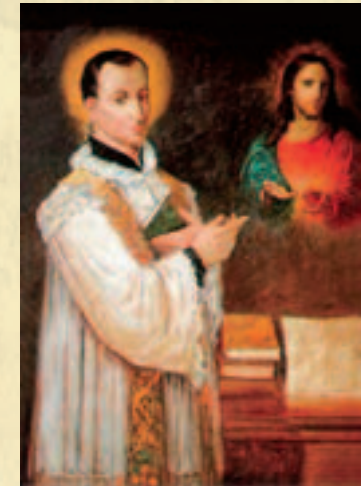
Sv. Klauđije La Colombière

Meditirajući o strpljivosti Isusa koji trpi, sv. Klauđije La Colombière je našao u Srcu Isusovu savršenu školu praštanja. O tome je zapisao: Neka Srce Isusa Krista bude naša škola!