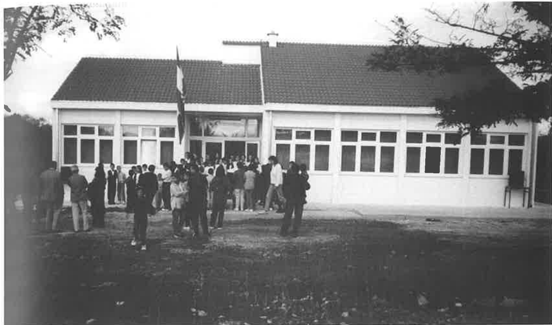
Nova škola u Kaočinama