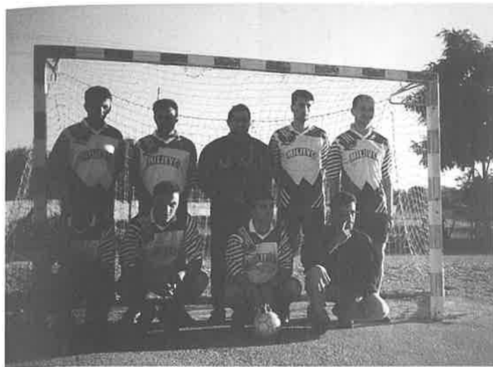
Nogometna ekipa Miljevaca

Uz domaći pršut vino i ostalog bilo je ugodno i dirljivo se sresti sa svojim su-borcima i ostalim nazočnim.