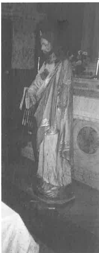
Kip u crkvi Imena Isusova gdje su mu srbočetnici odsjekli ruke

Za treće mjesto ekipa Miljevaca je pobjedila ekipu