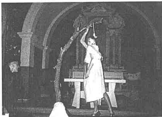
"Juda se objesio"

Svetkovina Svi sveti; obje crkve za ovaj dan pretijesne. Groblja okićena cvijećem i upaljenim svijećama. Poslije župne mise u Drinovcima Župnik pozvao vjernike na probu novog vina. Mali broj je došao probati vino.