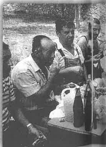
Nakon rada u crkvi zaslužena n