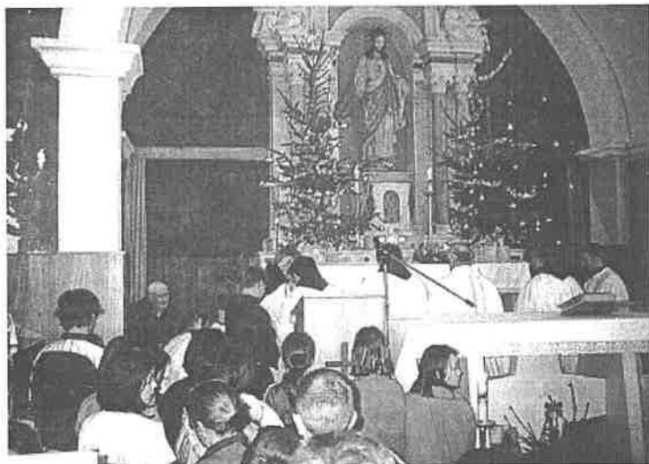
Blagoslovljeno Ime Isusovo

Ali me žena molila da još ostanem. Htjela je da zajedno upalimo svjetla na božićnom drvcu i da me počasti kavom i kolačima zato što sam dječaka svojim pričama tako divno zabavljao da je zaboravio na