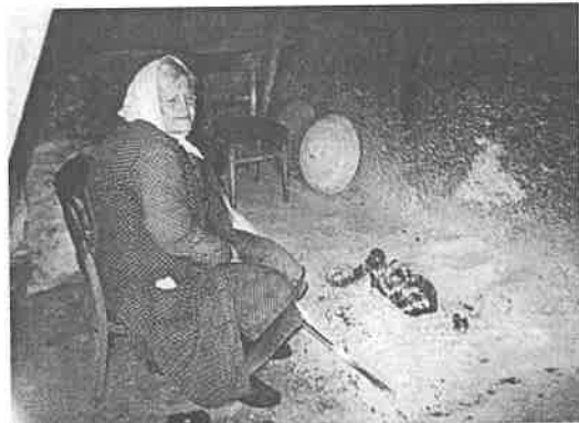
Baka uz kamin