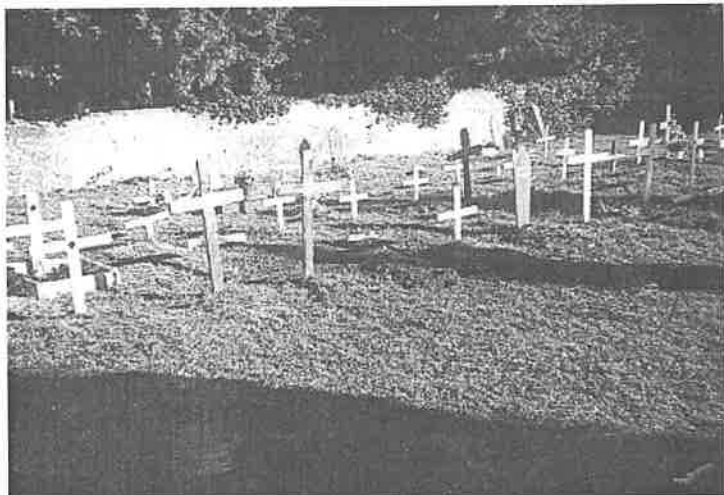
Pokoj vječni daruj im Gospodine!

(Članak preuzet iz fra Rafo Kalinić žrtva svoga svećeništva god. 1999. br. 10 str. 43-45.)