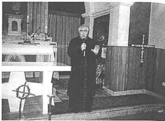
Šibenski biskup posjetio nas prigodom misija