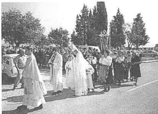
Procesija na blagdan Gospe od Milosti

Radnici elektrike iz Drniša izmještali stari vod električne energije iz groblja i braštine u Drinovcima i