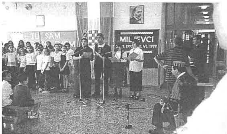
Prigodni program 300-te obljetnice župne crkve i 7. obljetnice oslobođenja Miljevaca