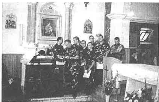
Hrvatski vojnici pjevaju za vrijeme mise

Zasjalo je sunce nad Miljevcima, kroz bistru zoru svanuo je 21. lipanj, dan koji pamte svi Miljevčani, i oni najmlađi, a posebno stariji. Tog dana i zvuk zvona Imena Isusova posebno su odzvanjala, kao da su cijelom svijetu, a posebno svojim Miljevcanima pjevala odu ponosa i radosti. Tristo godina stoji ponosita i velebna kuća Božja, duhovni dom Miljevcana, utočište od muka životnih, mjesto molitve, vapaja i nade za bolji život, za snagu, radost, utjehu pa i tugu. Ponosito i pobožno u društvu visokih čempresa uzdiže se naša crkva Imena Isusova. Tog dana, 21. lipnja 1999. okupio se miljevački narod, veseo i pobožan u krilu svoje crkve, na svetoj misi kojom se slavilo i molilo postojanje naše katoličke vjere kroz tri stoljeća. Ta vjera našem čovjeku daje snagu za postojanost i opstanak na ovom području, ali i obećanje