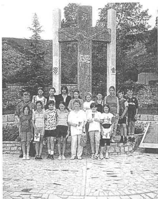
Dječji pjevački zbor kod spomen znaka u Gorici

Dana 08. srpnja smo kao članovi crkvenog zbora išli na izlet u Imotski. Ujutro smo rano ustali.