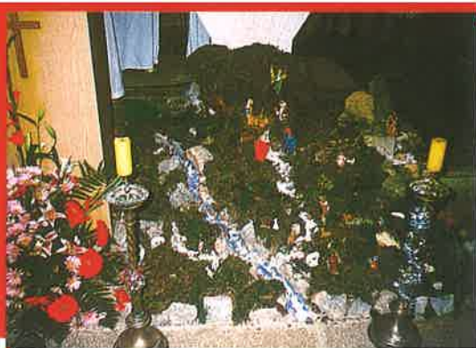
Jaslice u crkvi Sv. Petra i Pavla