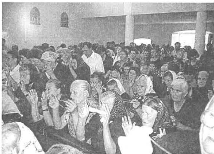
Sveta Marijo Majko Božja moli za nas...

Zato čovjek nije najbjednije stvorenje kako zaključuju oni koji Boga ne poznaju. Istina, čovjek se osjeća nespokojnim zbog patnji i smrti, ali je to zbog toga što njemu pripada više od onoga što jest i što može biti. Zato "čovjek nije ono što jest nego ono što će biti" (Silesius). Što je to što će on biti? Isus nam na to pitanje daje odgovor. U njemu je došla do izražaja sva ljudska