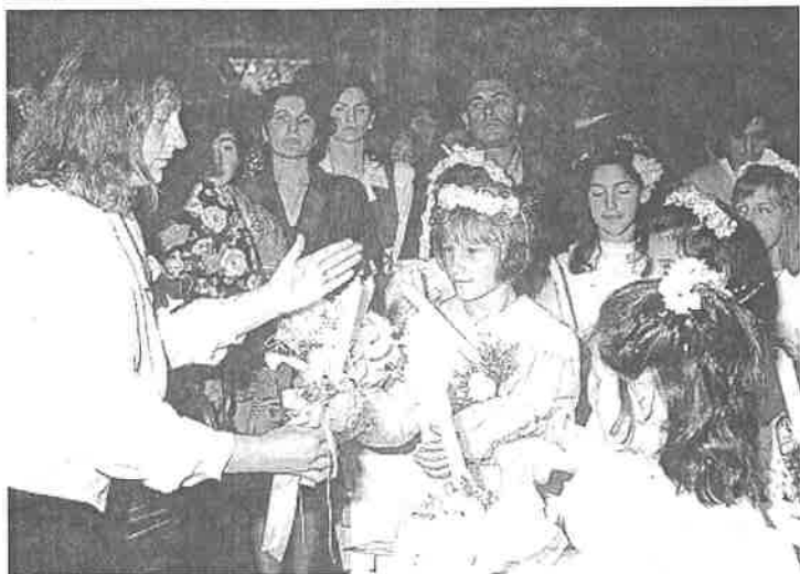
Vjera je svjetlo kroz život

bijeda i veličina. Svojom patnjom i smrću očitovao je ljudsku bijedu, a svojim zajedništvom s Bogom i uskrsnućem očitovao je ljudsku veličinu i puninu. Dakle, svi oni koji vjeruju u istinu uskrsnuća živjet će životom vječnim. U toj vjeri mi smo sinovi uskrsnuća. Zato Isus od nas traži vjeru, "želi je od čovjeka i želi je za čovjeka" (Ivan Pavao II.). Ta vjera u život vječni oslobađa čovjeka od svih bojazni i svakoga zla budući da je "moć Kristova Križa i Njegova Uskrsnuća veća od svakoga zla kojeg bi se čovjek mogao i morao bojati" (I. Pavao II.). Jedino Križ stoji čvrsto i samo onaj koji ogleda svoj život u njemu može se nadati spasenju - vječnom životu. Križ je velika istina Božja kao i uskrsnuće Isusovo. Toj velikoj istini Božjoj valja izručiti sebe, a to znači povjerovati i otvoriti se Bogu koji se objavljuje. Treba nam predanjem Bogu ući u istinu vjere i trajno u spoznaji i djelovanju napredovati. Stoga je veoma važno i presudno živjeti osnove vjere koje nalazimo u apostolskom i nicejskom vjerovanju, koja trebaju postati predmetom našeg svakodnevnog razmišljanja i djelovanja. S pravom Sv. Jeronim kaže: "Ti ćeš stvari shvatiti kad ih