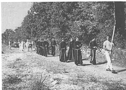
Budući naši župnici - franjevački novaci s Visovca

Vašoj djeci vi morate biti uzor, vaša ljubav i naš brak. A kad djeci dajete ljubav i sigurnost, onda im dajete sve. Bez ljubavi dijete ostaje zauvijek siromašno.