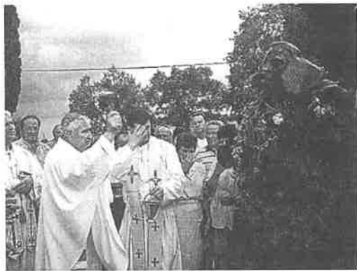
Šibenski biskup blagosiva bistu kardinala Utišinovića

(prigodom otkrivanja poprsja 21. lipnja 1999.)