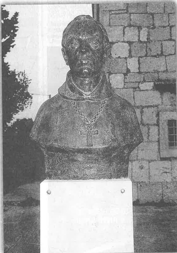
Kardinal opet na svom mjestu