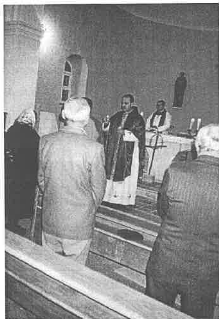
Misionar dijeli Svetu pričest