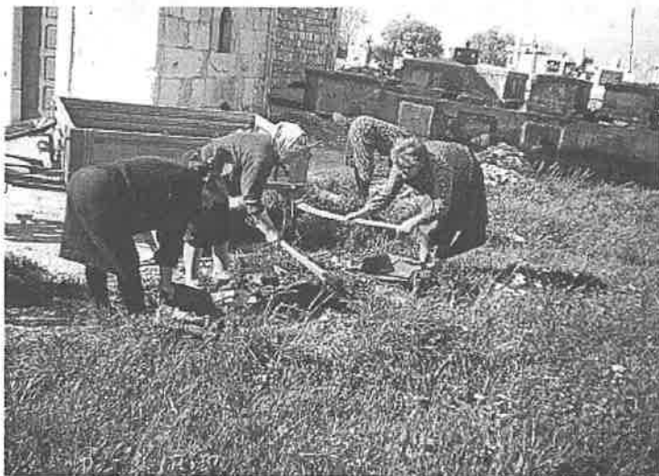
Uređenje groblja crkve Imena Isusova