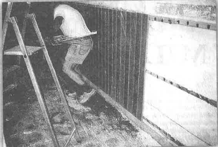
Skida se stara dotrajala lamperija