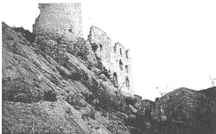
Nelepića kula u Ključu

vojnici koji su ostali kod kuće bili su uhićeni. Nije bilo nikakva suđenja. Nad njima su izvršili strašan pokolj. Ubijali su ih na mjestu zarobljavanja, u kući ili na polju.