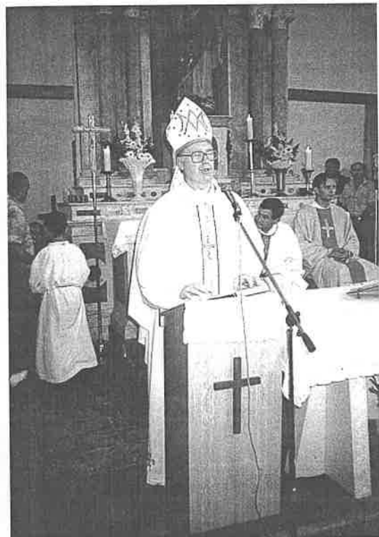
Otac biskup propovjeda

Potrebno je da vaša djeca u svojem domu upoznaju i osjete ljubav, da u svojem domu završe fakultet ljubavi.