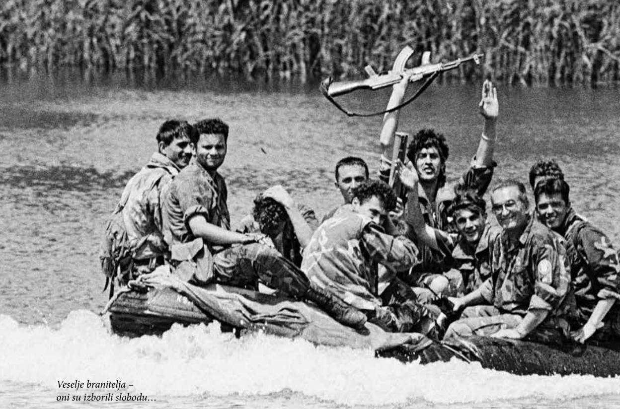
Veselje branitelja – oni su izborili slobodu...