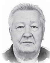
Nikola Rimac + 23. 4. 2020.