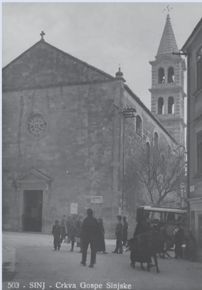
503 - SINJ - Crkva Gospe Sinjske

Dan sv. Petra i Pavla svanuo je vedar i lijep. Za četiri dana gotovo je neprestano padala kiša, i strepili smo od pomisli, da bi nam ona mogla omesti veliko slavlje. Ali dobri Bog nasmiješio